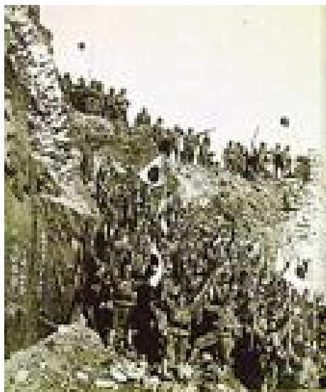
映画「南京の真実（仮題）」

◆ ご支援いただきました皆さまには、1口につき映画「南京の真実（仮題）」DVDを1枚進呈させていただきます。