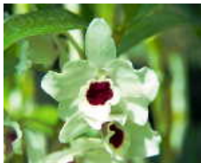
花言葉 わがままな美人

ギリシャ語のデンドロン（樹木）とピオン（生活する）からの命名です。熱帯アジア中心に約1200種も分布しています。